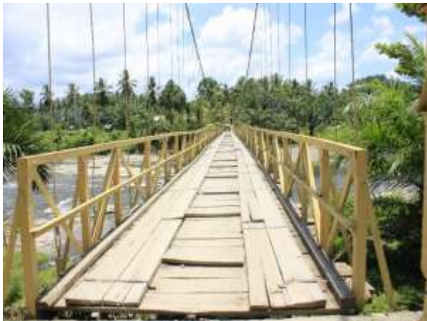
Jembatan Gantung Air Selepah, membutuhkan pembangunan