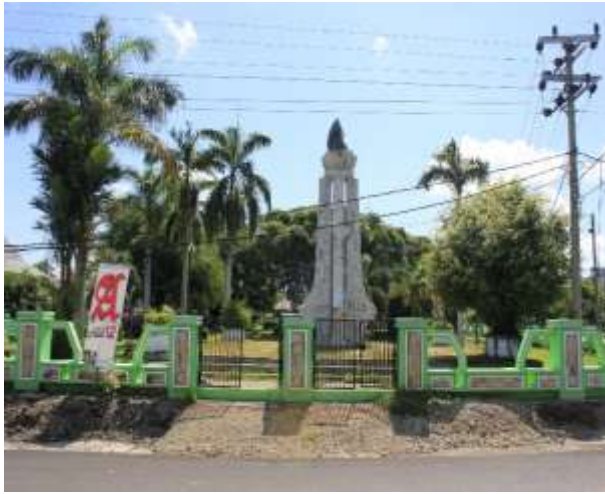
Tugu Merdeka terletak di depan Kantor DPRD Kab. Bengkulu Selatan