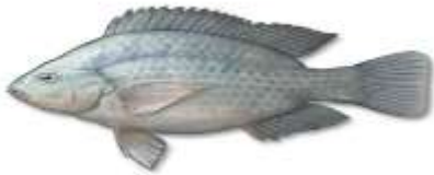
Ikan Nila ( Oreochomis niloticus )