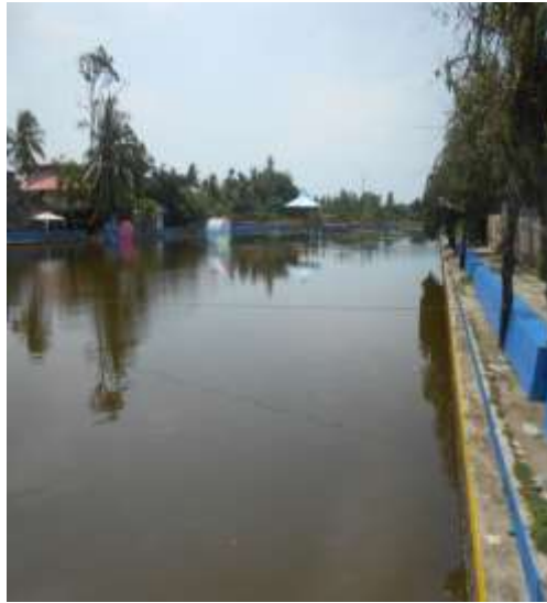
Tebat Rukis Jalan Raya Rukis Kelurahan Tj. Mulya Kecamatan Pasar Manna Kabupaten Bengkulu Selatan Provinsi Bengkulu terletak di tengah kota