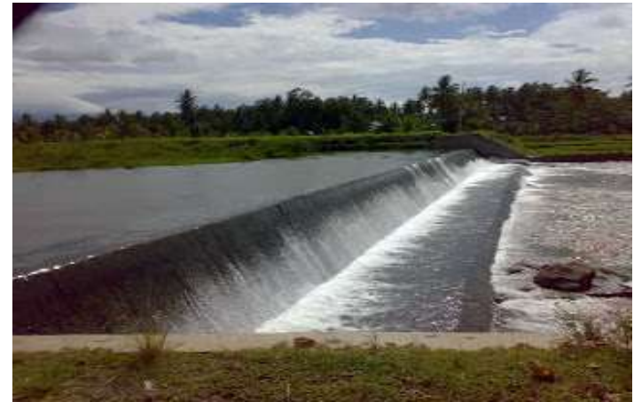
Bendungan Air Selepah Desa Babatan Kecamatan Air Nipis Kabupaten Bengkulu Selatan, sudah dibangun, jalan menuju kesana aspal hotmex dari Manna +_ 60 Menit, tetapi jembatannya belum permanen