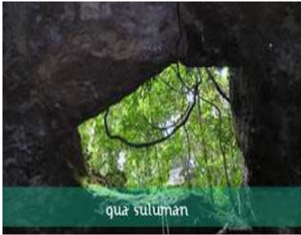
Gua Suluman, membutuhkan pembangunan jalan akses menuju lokasi +_ 1 Jam dari Manna