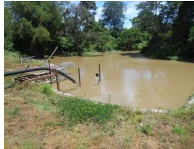
Sungai Selali, belum ada Pembangunan jalan akses menuju lokasi dari Kota Manna +_ 30 Menit