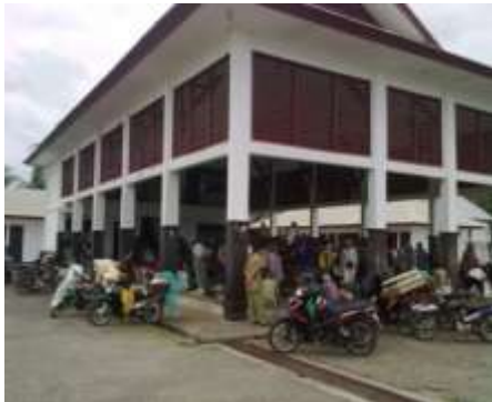
Gedung TPI Pasar Bawah