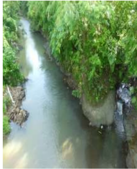
Air Sungai Meretam Jalan Desa Suka Jaya Kecamatan Kedurang Ilir Kabupaten Bengkulu Selatan Provinsi Bengkulu, letak di Jalan lintas Manna Kaur