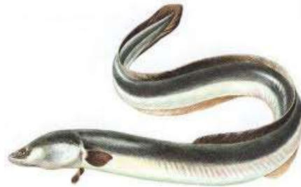
Ikan Sidat ( Anguilla marmorata )