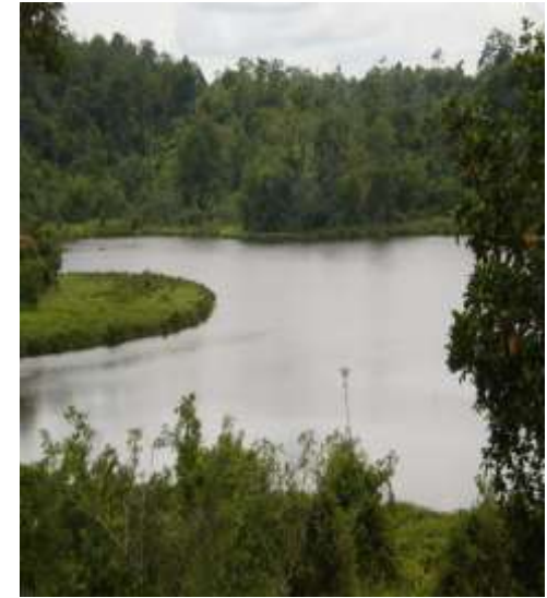
Danau Desa Muara Danau Kecamatan Seginim Kabupaten Bengkulu Selatan Provinsi Bengkulu, membutuhkan pembangunan jalan dan Jembatan akses menuju kesana dari Manna +_ 60 Menit