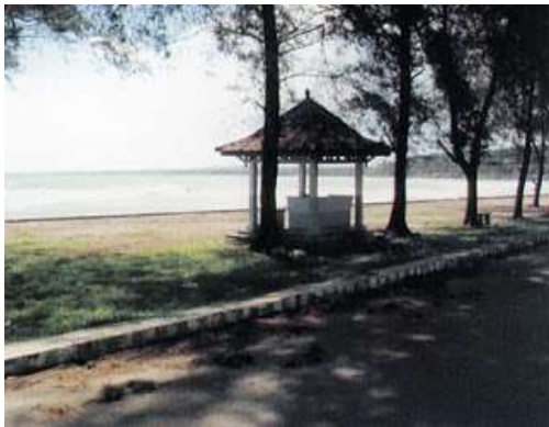
PANTAI PASAR BAWAH