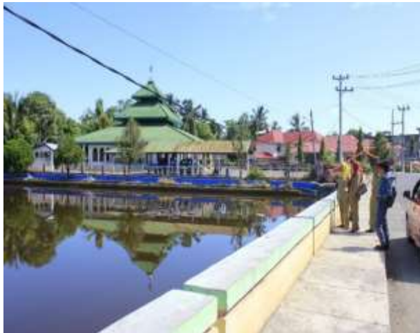
Masjid Rukis terletak di tengah kota Manna