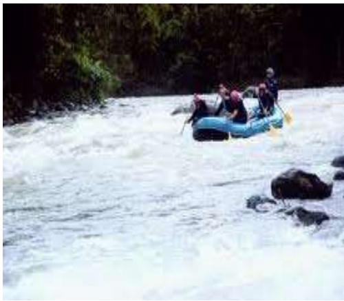
Arung Jeram, membutuhkan pembangunan jalan akses menuju kesana +_ 2 Jam dari Manna