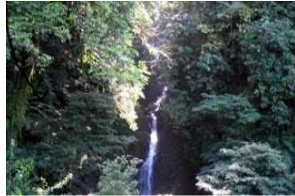
Air Terjun Batu Terika, membutukan pembangunan jalan, melewati perkebunan kelapa sawit sepanjang 3 Km dari desa Bumi Agung. Kec. Kedurang