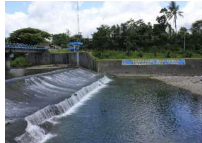
Bendungan Air Nipis, sudah dibangun