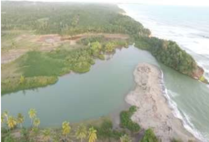
Muara Sungai Pino Jalan Desa Kerta Pati Kecamatan Pino Raya Kabupaten Bengkulu Selatan, sudah ada rencana untuk dibangun pelabuhan kapal