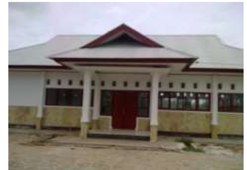
Gedung Pertemuan Nelayan