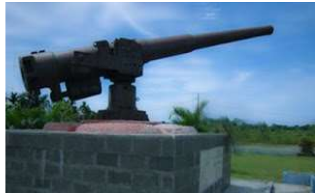
Meriam Peninggalan Penjajahan Jepang, terletak di Jalan Raya Padang Panjang Manna depan Kantor Bupati Bengkulu Selatan